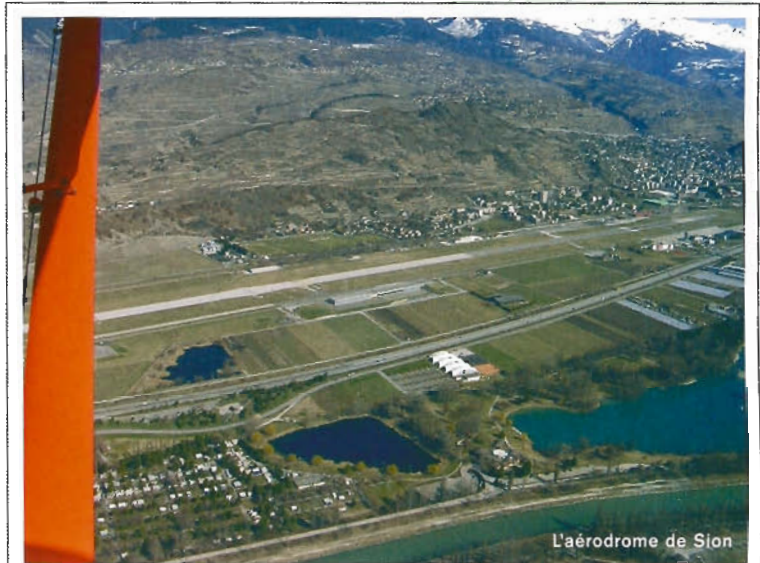
L'aérodrome de Sion

Finie ma béatitude burlesque, nous sommes maintenant sustentés et nous devons repartir : au pays de l'horlogerie, avant l'heure c'est pas l'heure et après l'heure c'est plus l'heure. Surtout, quand on pilote un avion peint aux couleurs de Breitling, il faut savoir être ponctuel pour le retour et respecter notre plan de vol. La dernière étape s'avère la plus pittoresque. Cap en direction du sommet mythique des Alpes. Je vois tout d'abord apparaître la dent d'Hérens (4 171 m) que je confonds un instant avec le Cervin (4 478 m) qui finalement se dévoile à moi. Sur notre gauche, une grande dame, la Dent-Blanche s'élève jusqu'à 4 357 m. Un peu plus loin, le Weisshorn (4 505 m) domine les autres sommets. Après une volte (je m'entraîne à parler suisse) dans le sens contraire des aiguilles d'une montre suisse autour du Mat-