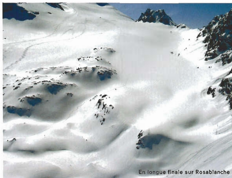
En longue finale sur Rosablanche