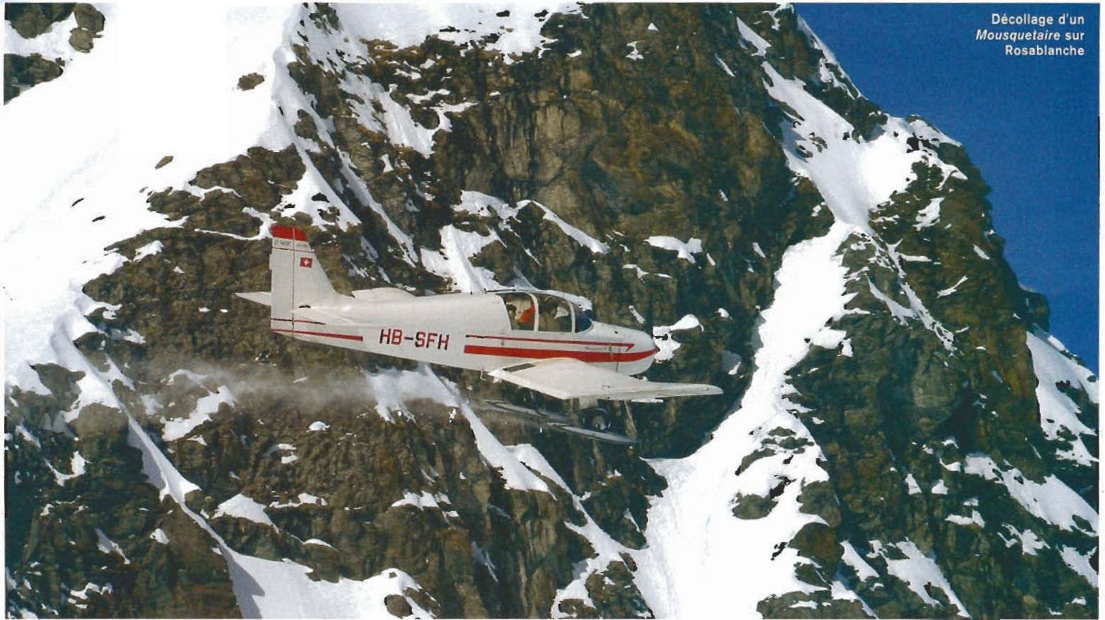
Décollage d'un Mousquetaire sur Rosablanche

Messieurs, nous arrivons à destination et allons atterrir dans quelques minutes sur le glacier de Rosablanche. Je vous prie d'attacher vos ceintures de sécurité, de ranger votre tablette devant vous et de redresser le dossier de votre siège. Blaise's Airlines vous remercie d'avoir choisi notre compagnie et nous espérons vous revoir bientôt ». Une fois à terre, je hurle mon indignation syndicale. Mais cette contestation a peu d'effet et je vais soulager mon courroux en ingurgitant le repas que Blaise a apporté. Je saute avec ma grâce coutumière hors de la machine et m'enfonce dans le sol. En me voyant patauger dans la neige légèrement poudreuse avec mes baskets, Blaise me regarde d'un air narquois et je lis dans ses yeux une lueur de sarcasme. Je m'abstiens de lui dire que mon jean noir ne reflète pas la chaleur et que je commence à cuire des jambes. Dans ces moments-là, le silence est d'or, surtout que je n'ai pas arrêté de vanter mes qualités de montagnard ! À peine avons-nous commencé à déguster le gruyère suisse (pas très original, mais apaisant pour mon estomac !) qu'un ballet d'avions se déroule devant nos yeux. C'est nettement mieux que la télé. Un Mousquetaire D-140 arrive, le Super-Cub redécollé et re-