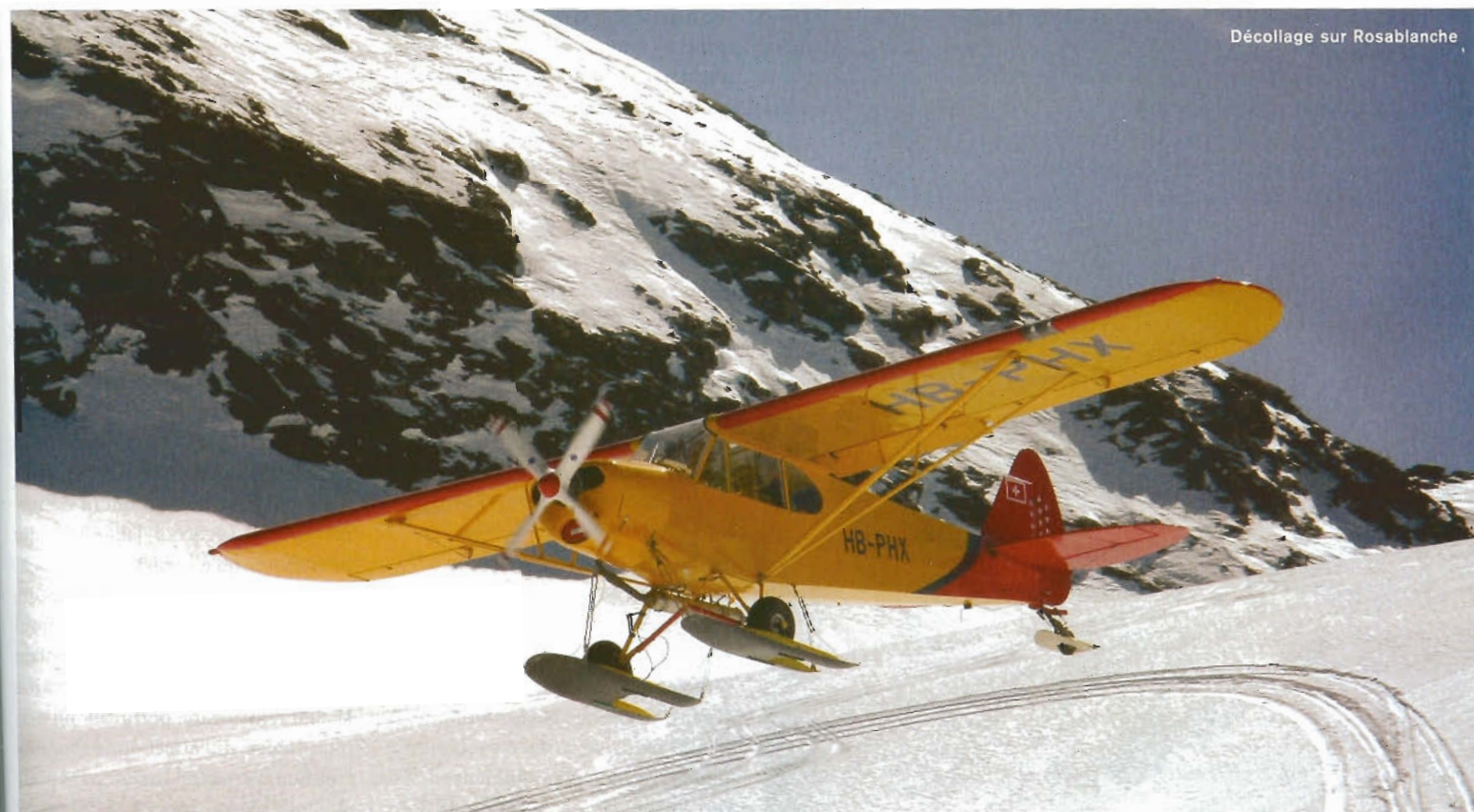
Décollage sur Rosablanche

veille. Par contre, il y a toujours une pale dans le champ de vision, ce qui rend la prise de photos problématique. On ne gagne jamais à tous les coups dans ce haut monde. Un décollage de plus et nous voilà partir vers le nord-est. Le guide Intourist derrière moi énumère avec enthousiasme et sans défaillance le nom de tous les sommets que nous croisons. Je prends mentalement note du Grand-Combin. La face sud est relativement facile d'accès et pourra constituer un objectif montagnard dans le futur. Nous voilà maintenant