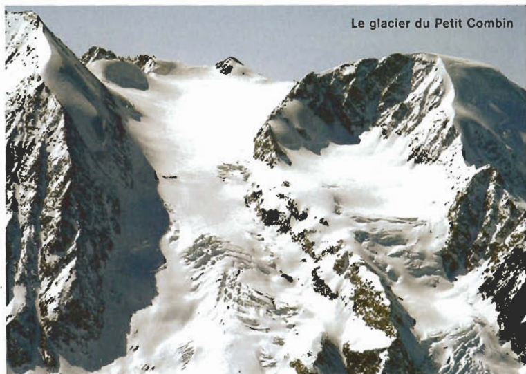
Le glacier du Petit Combin