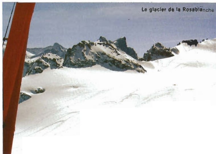
Le glacier de la Rosablanche

j'admire ces volatiles lorsque je vais faire du ski de randonnée, mais à date, aucune révélation n'a encore illuminé mon esprit. Il va falloir qu'elle survienne rapidement car je suis dans le besoin. Donc je passe en finale après une volte qui s'apparente plus à une pirouette désordonnée et je me positionne face à la trace. Je remarque maintenant clairement la configuration du lieu. Tout d'abord une première bosse suivie d'une cuvette et j'effectue l'arrondi sur le dernier profil convexe. La tenue du plan s'est avérée complexe. Le pre-