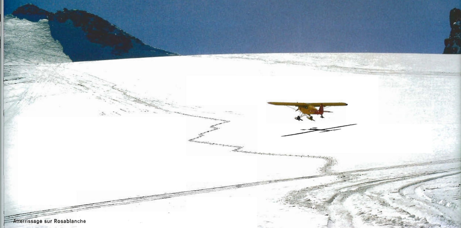
Atterrissage sur Rosablanche

En venant d'Albertville, le massif du Beaufortain nous offre le premier aperçu des hauteurs alpines. Puis, le col du Joli franchi, la Haute-Savoie nous accueille et la sarabande des sommets peut commencer. Après le glacier du Tour, ce sera la Suisse et l'escale à Sion, d'où nous repartirons pour une exceptionnelle tournée des glaciers.