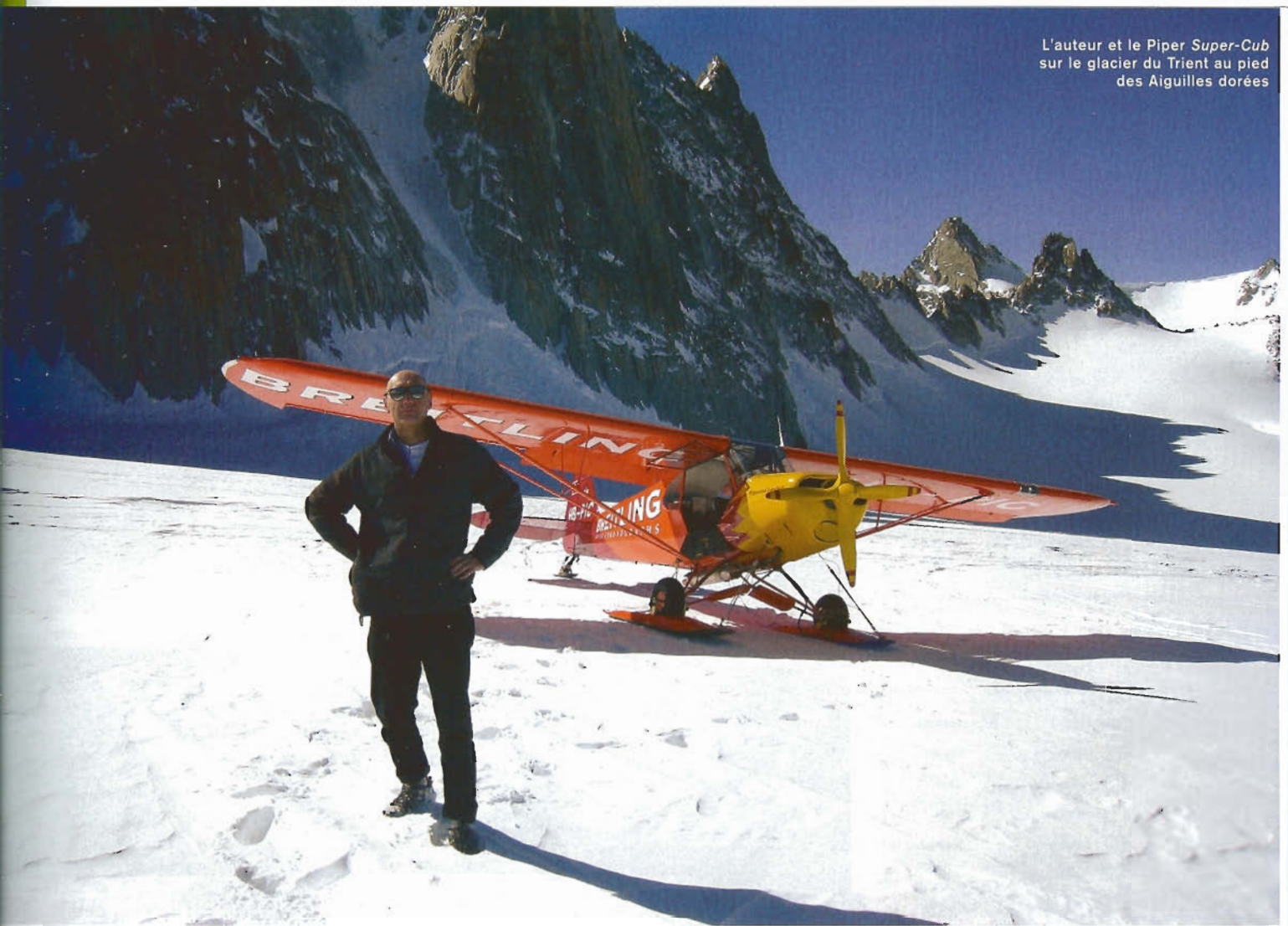
L'auteur et le Piper Super-Cub sur le glacier du Trient au pied des Aiguilles dorées